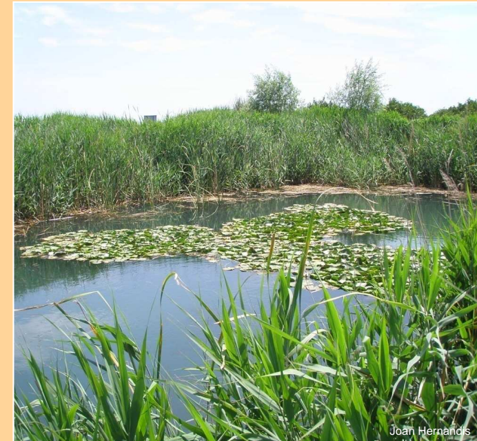
Ullal de la Mula